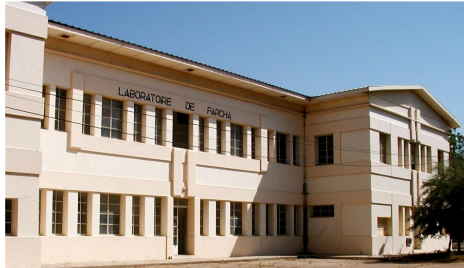
Laboratoire de Recherches Vétérinaires et Zootechniques - Chad