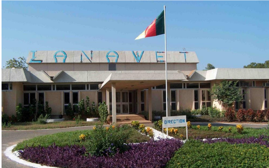
Laboratoire National Vétérinaires - Cameroon

ACP-EU Cooperation Programme in Higher Education (EDULINK). A programme of the ACP Group of States with the financial assistance of European Union.